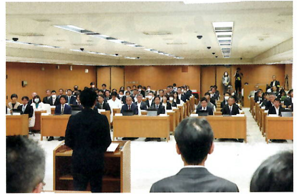
5/19本会議の様子から