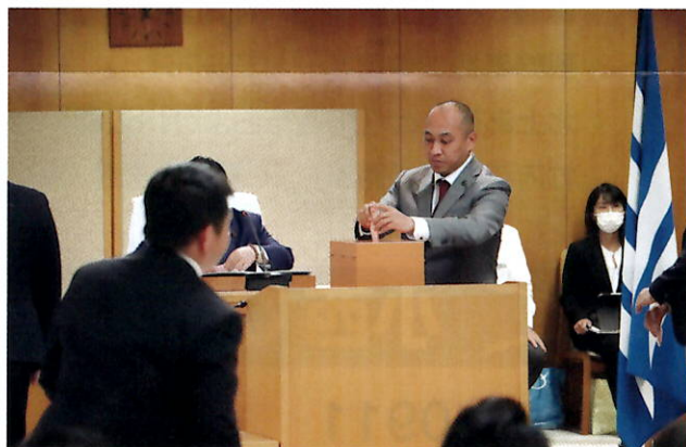
5/16本会議の様子から

これまで使用していた議場棟が耐震不足と判明したため、議場を県庁3号館7階の大会議室に移しておこなわれました。新しい議場については、県庁再整備の議論もふまえて検討されます。